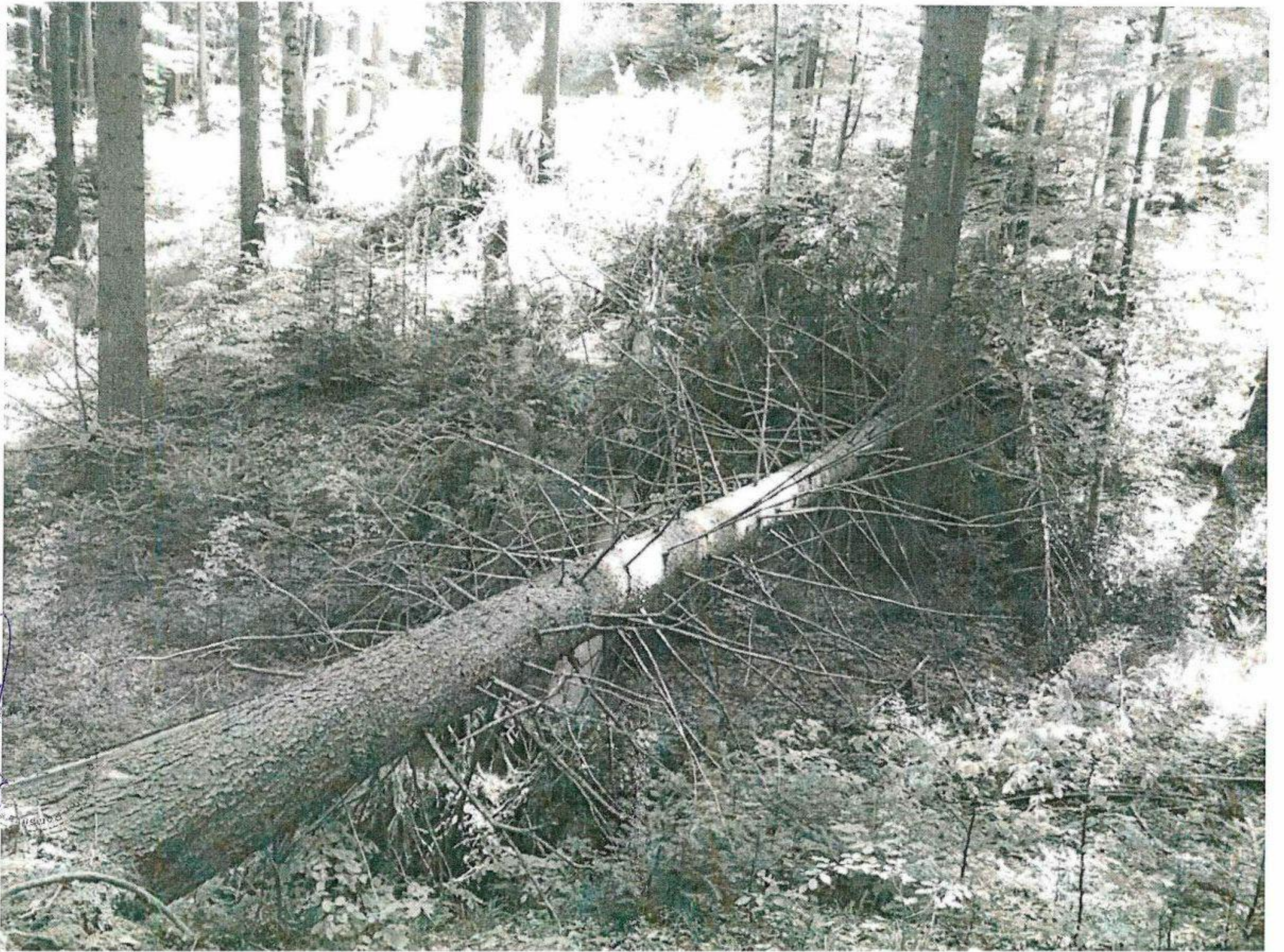
Partida nr. 4 Aei Canal Biscui

Handwritten notes in blue ink, including a small sketch of a tree trunk and some illegible text.